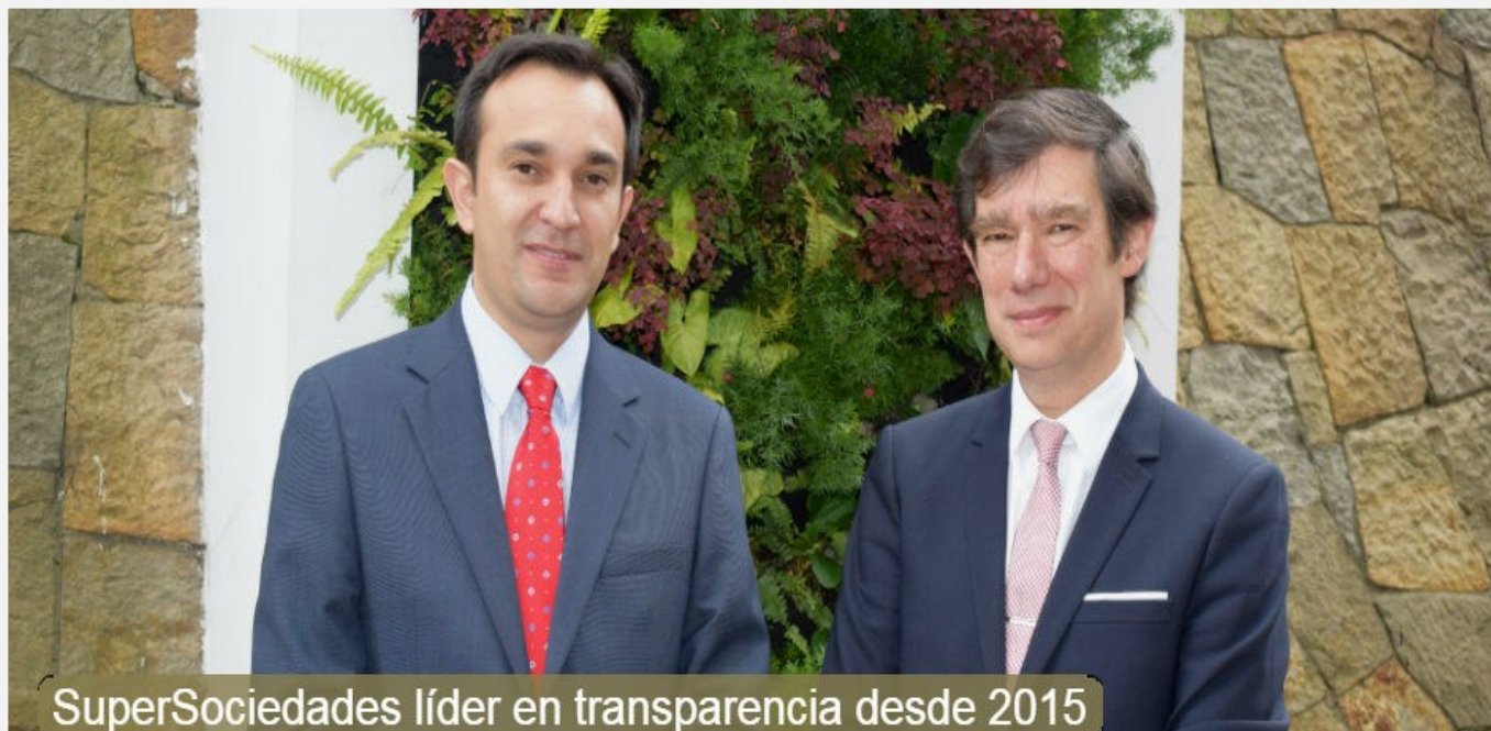
SuperSociedades líder en transparencia desde 2015